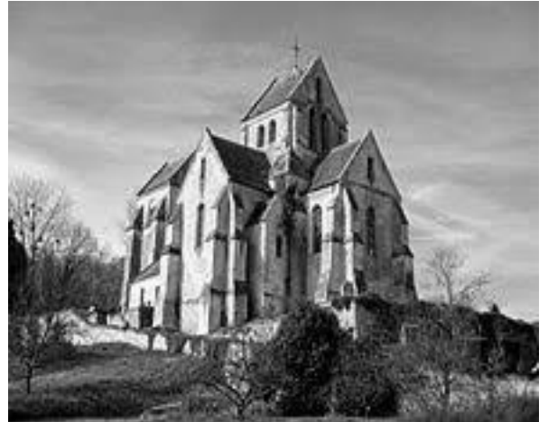
Eglise de Septvaux