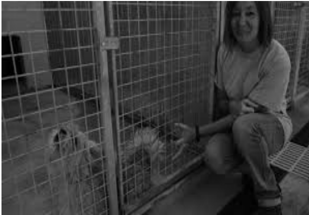
SPA de Laon