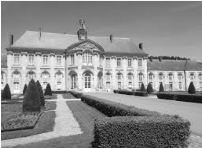
Abbaye de Prémontré