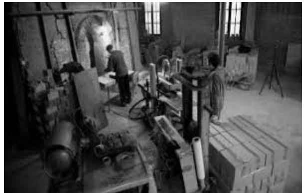
Poterie de Saint-SAMSON-LA-POTERIE